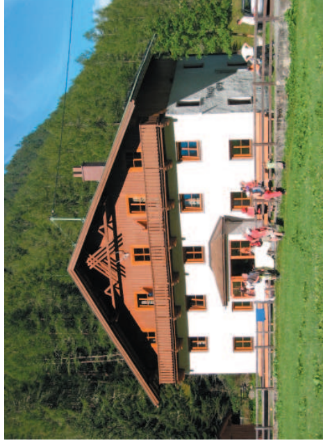
Die Tiroler Hütte in Gries

www.tirolerhuette.de www.oetztal-online.at www.naturpark-oetztal.at